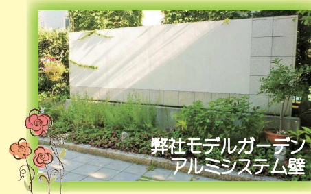
弊社モデルガーデン アルミシステム壁

ブロック塀を使わず、アルミ製品やフェンス、生垣など安全な外壁の提案をさせていただきます