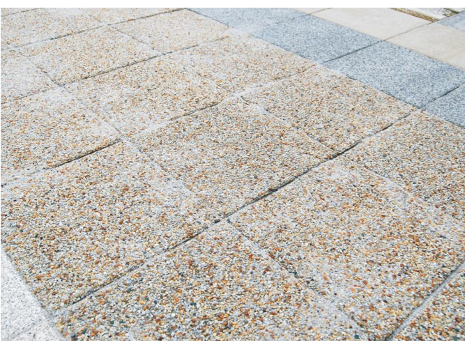
洗い出し平板 (透水性)